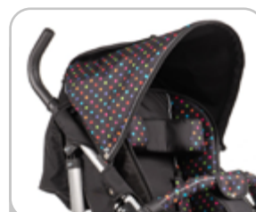
czarna w kolorowe groszki